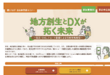
自治体実務セミナー