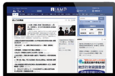
行政専門ニュースサイト