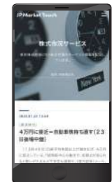
LINE/メール 個人向け情報配信