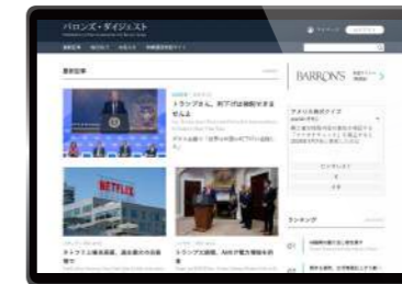
米国株投資情報サービス