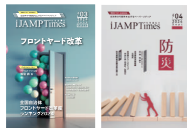
ペーパーメディア